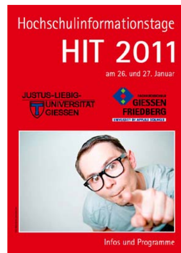
Abb. 2 HIT-Broschüre 2011

Die einzelnen Fachprogramme werden von den Fachbereichen geplant und angeboten. Die Rahmenorganisation (u.a. die Gestaltung und Erstellung von Informationsmaterialien wie Flyer, Plakate, Broschüre, die Kommunikation mit den Schulen, der Versand der Broschüren, die Bereitstellung von Informationsmaterial für die einzelnen Fachprogramme sowie die Administration des Anmeldeverfahrens) liegt im Zuständigkeitsbereich der ZSB.