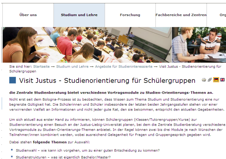
Abb. 5 Internetinformationen zu „Visit Justus“

Bewerbungs- und Zulassungsregelungen nicht (mehr) kennen und somit ihre Schüler/innen nicht adäquat unterstützen können. Auf den Internetseiten der JLU werden Termine für Gruppenbesuche (i.d.R. ein Termin pro Monat) sowie verschiedene Vortragsmodule zu Studienorientierungsthemen bekanntgegeben. Lehrer/innen können sich mit ihren Klassen für einen der genannten Termine anmelden und zwei bis drei Module auswählen, wobei ausreichend Gelegenheit für Fragen und ein Gruppengespräch gegeben wird.