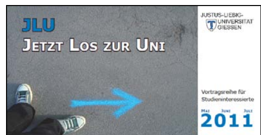
Abb. 4 Flyer der Vortragsreihe 2011

Im Rahmen dieser Vortragsreihe werden Studiengänge vorgestellt und für die unmittelbare Studienentscheidung relevante Inhalte wie Studienfinanzierung sowie Bewerbungs- und Zulassungsverfahren thematisiert. Berücksichtigt werden vor allem die Studiengänge, die besonders stark nachgefragt werden und für die schon in den letzten Jahren der Informations- und Beratungsbedarf nicht durch Einzelberatungsgespräche abgedeckt werden konnte. In der Vortragsreihe werden aber auch Studiengänge vorgestellt, die bei Studieninteressierten oft weniger bekannt sind und für die Studierende geworben werden sollen. Im Jahr 2011 wurden 16 Vorträge angeboten (jeweilige Titel siehe Tab. 9), die von insgesamt rund 700 Personen besucht wurden.